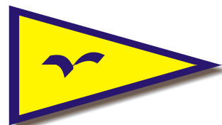
CLUB NAUTICO SCARLINO